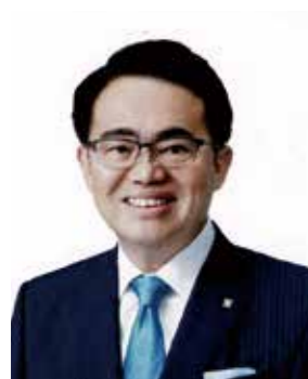
公益財団法人愛知県 スポーツ協会 会長 大村 秀章

結びに、日進市スポーツ協会が創立70周年を機に、今後益々発展されること、また会員の皆様のご健勝ご多幸を心から祈念申し上げます。